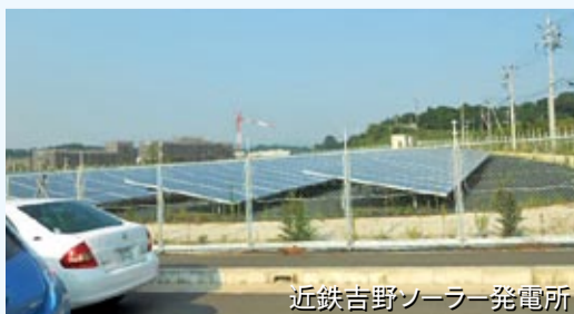
近鉄吉野ソーラー発電所