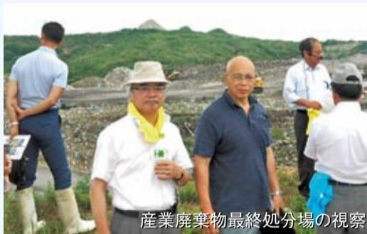
産業廃棄物最終処分場の視察