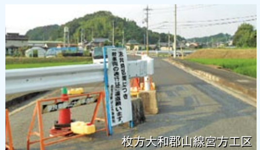
枚方大和郡山線宮方工区