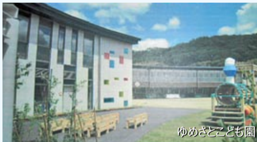
ゆめさとこども園