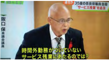
関西テレビ報道ランナー放映