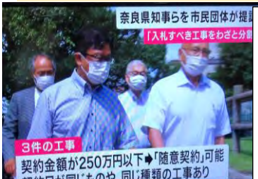
関西テレビ報道ランナー放映

複数の学校で工事の随意契約違反を繰り返す。工事代金を250万円以下にし、分割発注を行うものです。