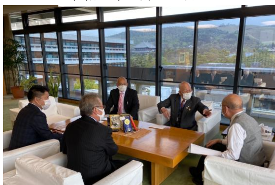
知事に要望書提出・面談（知事室）